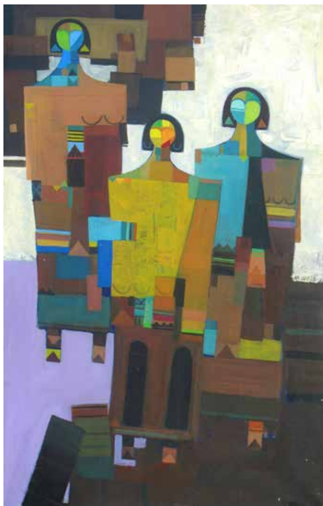
Huiles sur toile

Il nous emporte dans ses déferlantes de visages, de couleurs, d'ocres, de terre de la Mésopotamie dont il perpétue sillons et traces tel le Sumérien qu'il est.