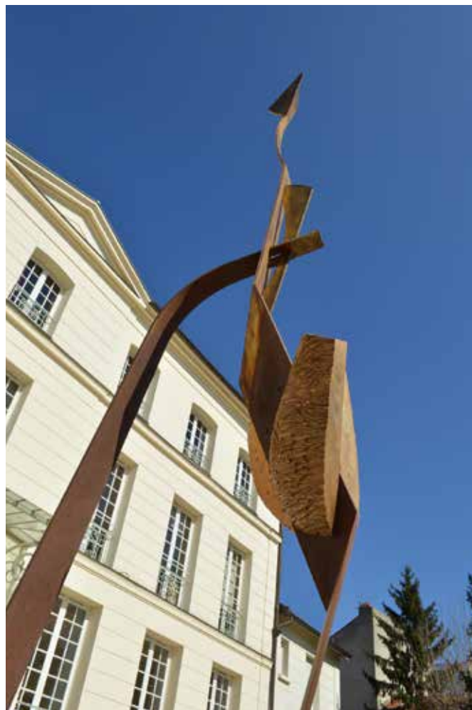
Hôtel particulier du Carré des Coignard à Nogent sur Marne «Figure humaine» une sculpture de François Gaulier, H : 2m80, acier et bronze

06 63 62 91 85 - contact@gaulier.fr - http://gaulier.fr